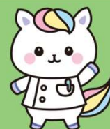
「看護の日」キャラクター かんごちゃん

看護師になるための進路について相談員がご説明いたします。 また、愛媛県内の看護学校の入学案内パンフレットをご自由にお持ち帰りいただけます。