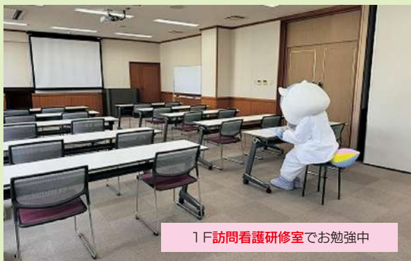
1F訪問看護研修室でお勉強中