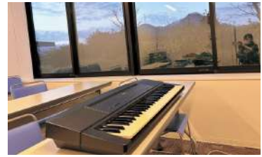
赤十字ゴスペルクラブ。 メンバーの参加を待っているところ

本年1月に、赤十字ゴスペルクラブを立ち上げました。まだ少人数の小さなクラブですが、看護師はもちろん医師やコメディカルスタッフとも声と心を合わせてみたいと思っています。