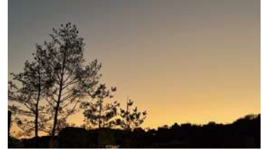
仕事帰りに病院の正面玄関から見える景色