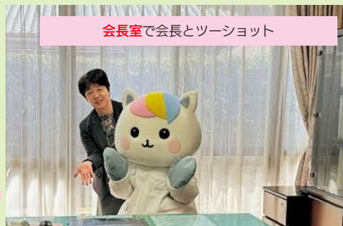
会長室で会長とツーショット