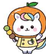
愛媛県 かんごちゃん