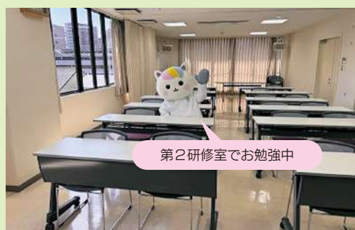
第2研修室でお勉強中