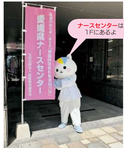
ナースセンターは1Fにあるよ