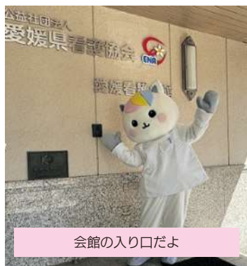
会館の入り口だよ