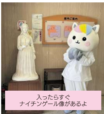
入ったらすぐ ナイチンゲール像があるよ