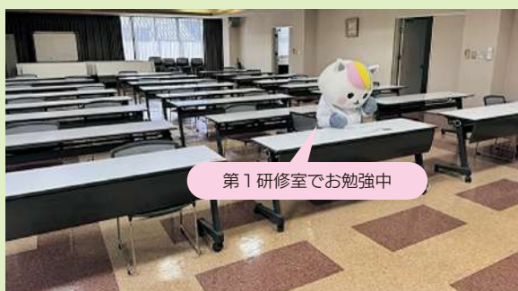
第1研修室でお勉強中

保健・医療・福祉との連携と看護の質向上をめざし、多職種と協働するための学習機会を提供しています。