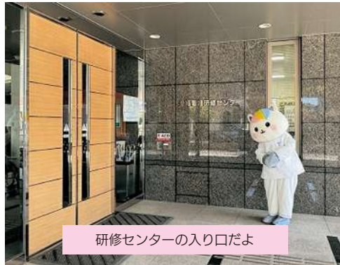
研修センターの入り口だよ

1Fには図書室や訪問看護ステーション愛媛もあるよ。 2Fの大研修室は定数350名。 広いね！