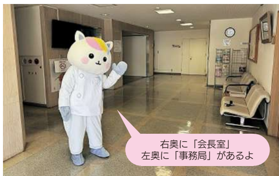
右奥に「会長室」 左奥に「事務局」があるよ