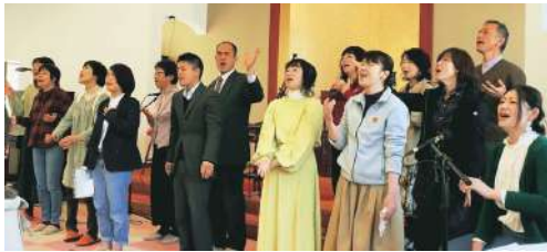
中南予で活動しているリジョイスの一場面

リードの合図で頭に戻ったり、サビの部分を繰り返したりと、心の感じるままに自由に歌います。