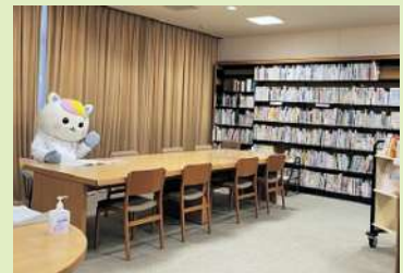
本や雑誌がいっぱいあるね