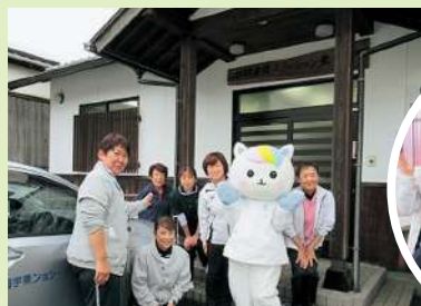
西予市宇和町にあるよ

自然豊かな西予市の宇和海から四国カルストを臨む山里まで、在宅へ安心と安全を届けています