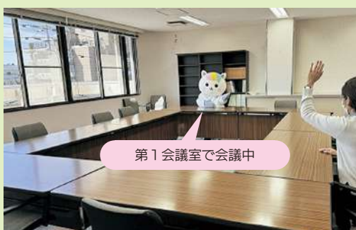
第1会議室で会議中