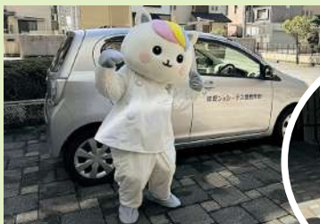
近くには自転車で訪問に行くよ

松山市を中心に「その人らしい生活を整え、関わりを大切にします」をモットーに活動しています。