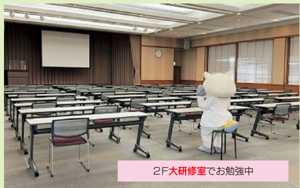
2F大研修室でお勉強中