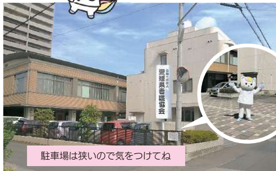
駐車場は狭いので気をつけてね