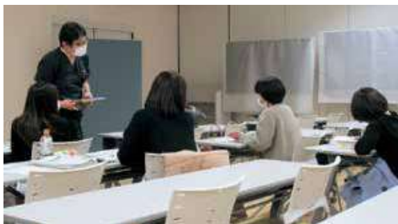
写真①【共通科目(演習)】

これまでに研修を修了した4名との情報交換を継続しながら、今後さらに効果的な研修になるよう取り組んでいきたいと考えています。