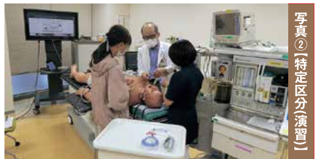
写真②【特定区分(演習)】