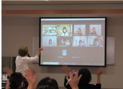
会場とオンライン参加者