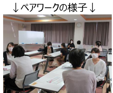
↓ペアワークの様子↓