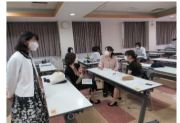
↑グループワークの様子↑